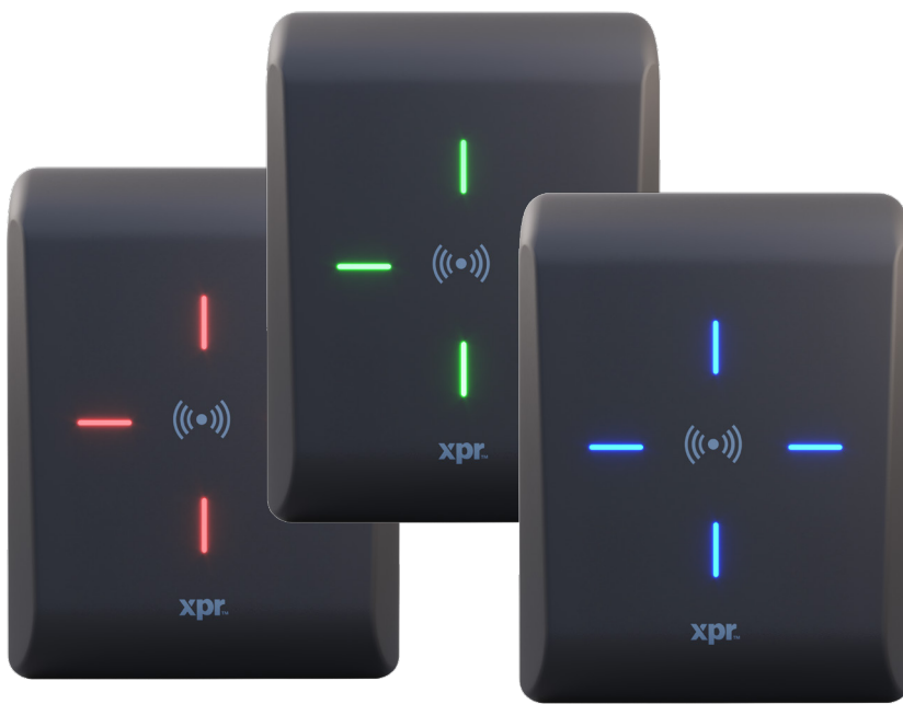
XP LECTOR RFID