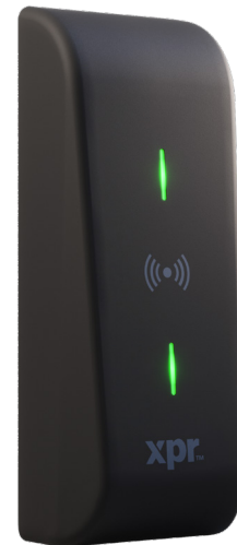
XPM LECTOR RFID ESTRECHO